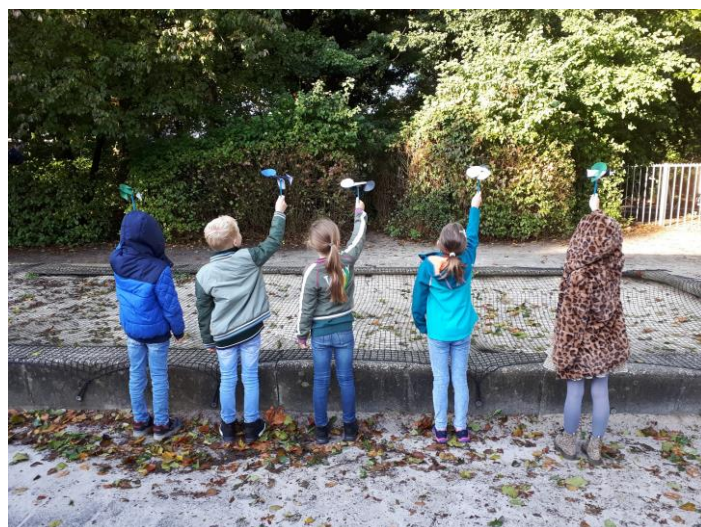
Groep 4 meet of er veel wind staat met zelfgemaakte windmeters

Deze module gaan de leerlingen van groep 5 t/m 8 meedoen aan de werkstukwedstrijd van het Wetenschapsknooppunt Zuid Holland. De leerlingen gaan volgens de onderzoekscyclus een onderzoekswerkstuk maken waarbij een zelfgekozen onderwerp wordt onderzocht. De werkstukken worden ingestuurd naar het Wetenschapsknooppunt en worden daar beoordeeld. Sommige werkstukken worden genomineerd en komen dus in aanmerking voor een prijs.